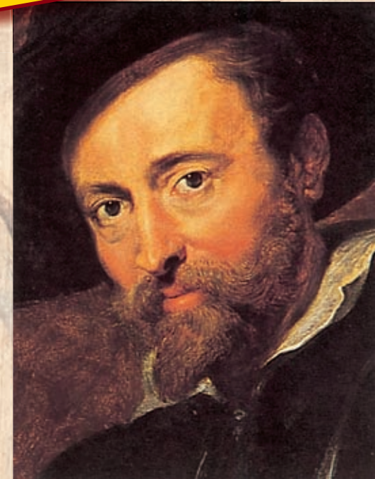
Pieter-Paul Rubens, Rubenshuis, Antwerpen

DVD 2 PARTS NEDERLANDS · FRANÇAIS · ENGLISH · DEUTSCH